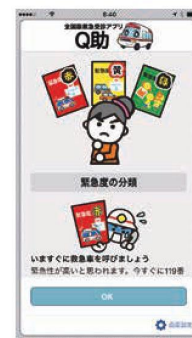
緊急度の分類説明