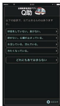
視覚効果 「明度反転」