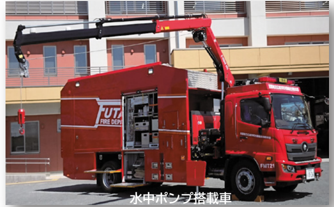
水中ポンプ搭載車

また、「林野火災対応資機材」を常時積載することが可能となり、災害発生時における効率的かつ効果的な活動がなされます。