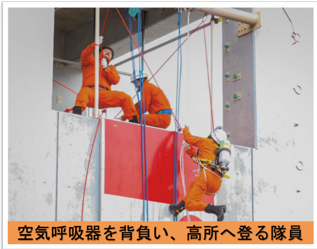
空気呼吸器を背負い、高所へ登る隊員