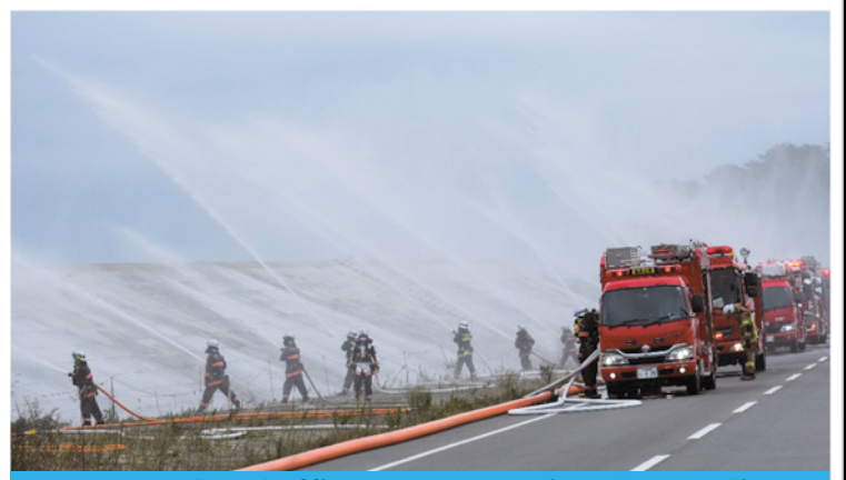
令和4年度大規模火災対応訓練風景（双葉町）

この訓練は、避難指示区域内において大規模な火災が発生したことを想定し、福島県内外の消防本部や自衛隊、消防防災ヘリなどの関係機関が参加し、迅速的確に対応することを目的に訓練を行います。