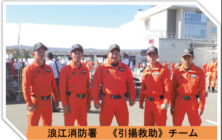
浪江消防署 《引揚救助》チーム

全国大会への出場は叶いませんでしたが、今後も東北大会出場の経験を活かし消防活動の質の向上に努めてまいります。