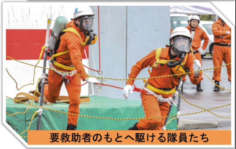
要救助者のもとへ駆ける隊員たち