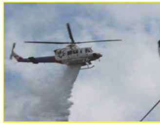
福島県消防防災ヘリによる 空中消火訓練