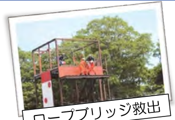
ロープブリッジ救出