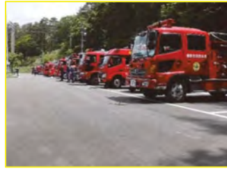
県内外消防隊参集訓練