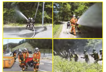
地上消火隊投入訓練