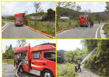
遠距離大容量送水訓練

県内外各消防本部、福島消防防災ヘリ、自衛隊、警察等多数の関係機関の参加もあり、実災害時の円滑な応援要請及び活動概要の確認をすると共に、大規模火災に対応するマニュアル整備等を行い、消防活動の充実強化に努めて参りたいと思います。